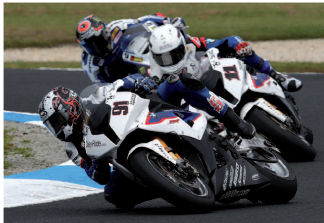
Auf der Bondexpo 2011 ist am tewipack-Stand ein BMW-Rennmotorrad S1000RR zu sehen.

Das BMW-Rennmotorrad S1000RR ist ein Leichtgewicht. Geheimnis dieser pfeilschnellen Maschine, die in der Superbike-WM auf dem Nürburgring im Einsatz ist, ist unter anderem die Carbon-Rennverkleidung von BECKER