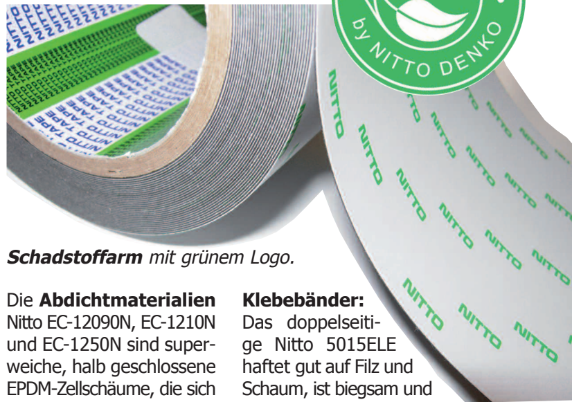
Schadstoffarm mit grünem Logo.

Die neuen, schadstoffarmen Produkte enthalten deutlich weniger Formaldehyd und Lösungsmittel, geben kaum Dämpfe ab und erzeugen wenig Geruch. Für Autofahrer ist das angenehm, denn Produkte von Nitto Denko werden in Fahrzeuginnenräumen verarbeitet, zum Beispiel an Armaturenbrett, Mittelkonsole und Tonabnehmer.