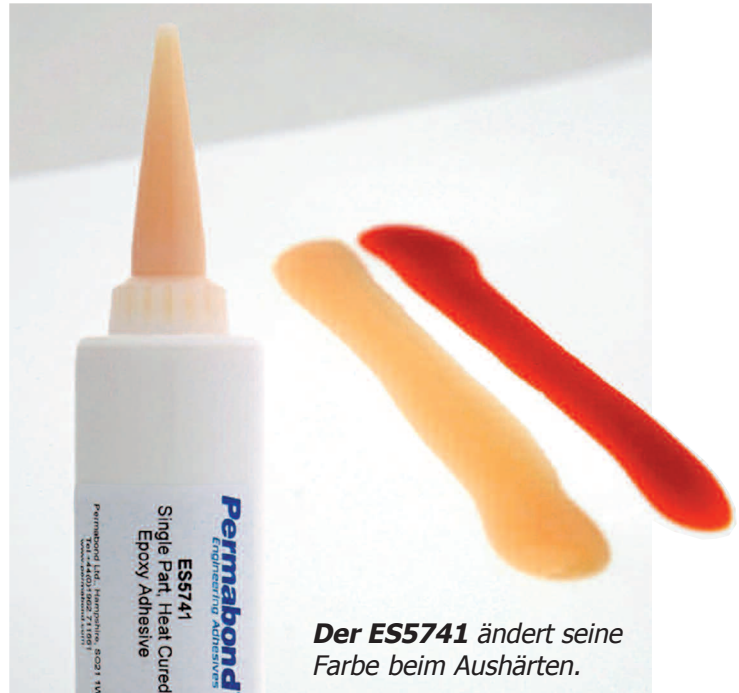
Der ES5741 ändert seine Farbe beim Aushärten.

von PBT mit unterschiedlichsten Materialien wie Kunststoff, Phenol und verschiedene Metalle. Für den Anwender bedeutet das eine viel größere Freiheit bei der Gestaltung und Materialauswahl. Auch schließt der Klebstoff kleine Spalten von bis zu 0,2 Millimeter, die mit Ultraschall oder Schweißen nicht bearbeitet werden können. Der große Vorteil des ES5741: Man erkennt sofort, wenn er vollständig ausgehärtet ist. Denn dann wechselt er seine Farbe.