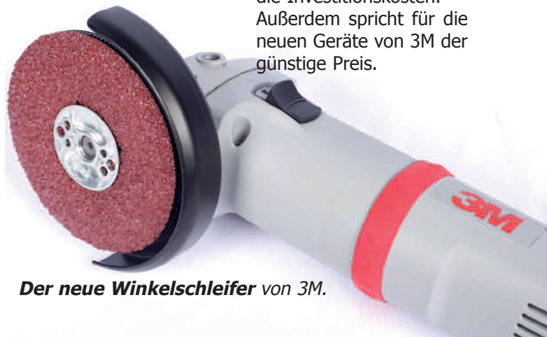
Der neue Winkelschleifer von 3M.

Der Anwender führt die Maschine wesentlich präziser, denn sie liegt ruhiger in der Hand und ist leiser. Das trägt natürlich zu höherer Prozesssicherheit und Minimierung von Ausfallzeiten bei. Weil die Lebensdauer länger im Vergleich zu anderen Geräten ist, reduzieren sich die Investitionskosten. Außerdem spricht für die neuen Geräte von 3M der günstige Preis.