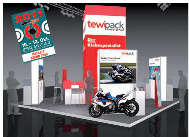
Am roten Turm erkennt man den tewipack -Stand.

Die Standnummer 7508 ist zwar geändert, dennoch sind die Klebetechnik-Spezialisten vom 10. bis 13. Oktober wieder leicht in Halle 7 zu finden. Schon von weitem ist der rote Turm von tewipack deutlich zu erkennen.