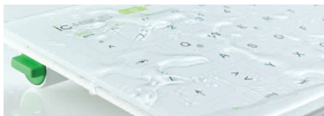
Aktuelle Anwendungen: LNT-Hygienetastatur und Dambach LED Leiste.

Beispielen wird schnell klar, dass die Vollsortiment-Anbieter auf ein sehr breites Angebot unterschiedlicher Hersteller zugreifen können.